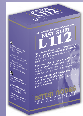
Emballage de 48 comprimés à 500 mg

Une boîte de 48 comprimés Fast Slim L112 suffira en moyenne pour 2 semaines.